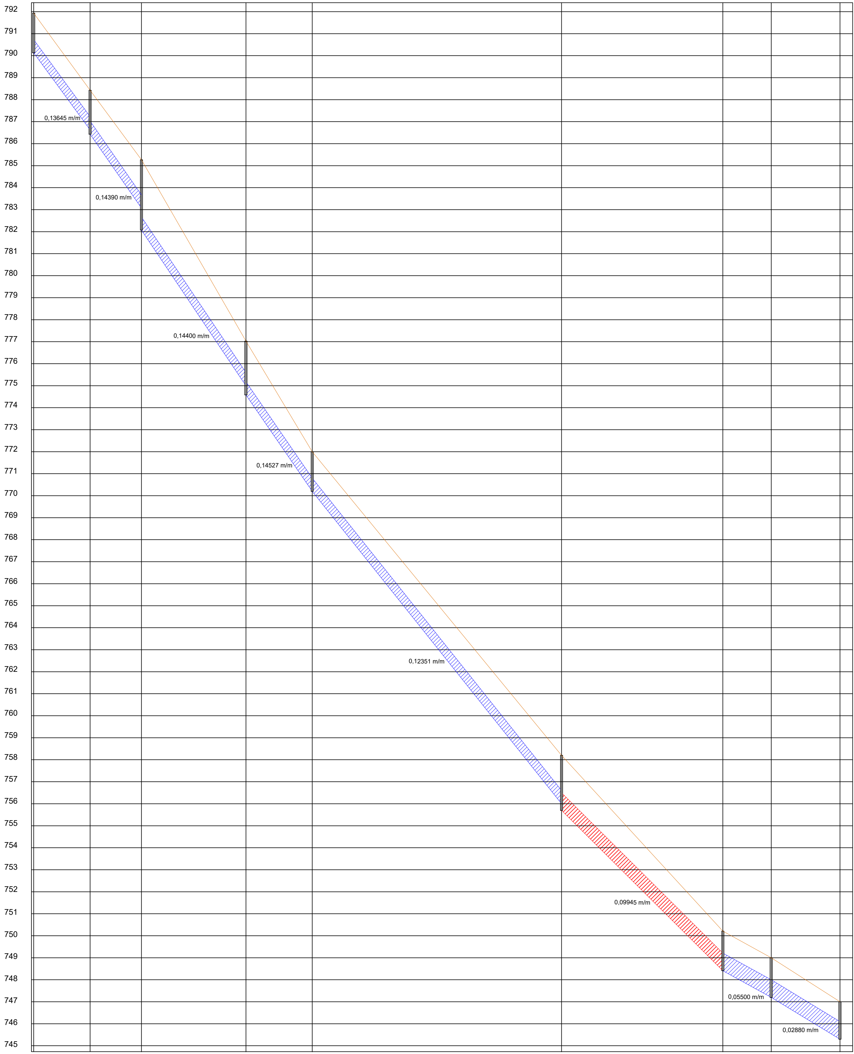
PERFIL DOS TRECHOS: ESCALA HORIZONTAL: 1:1.000 ESCALA VERTICAL: 1:100